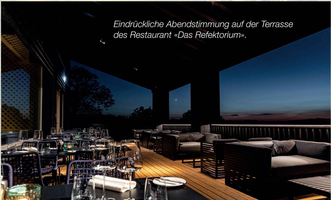
Eindrückliche Abendstimmung auf der Terrasse des Restaurant «Das Refektorium».