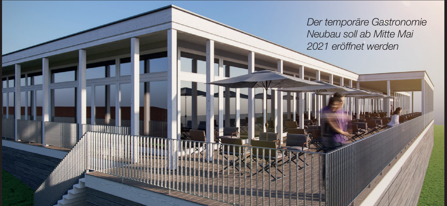
Der temporäre Gastronomie Neubau soll ab Mitte Mai 2021 eröffnet werden