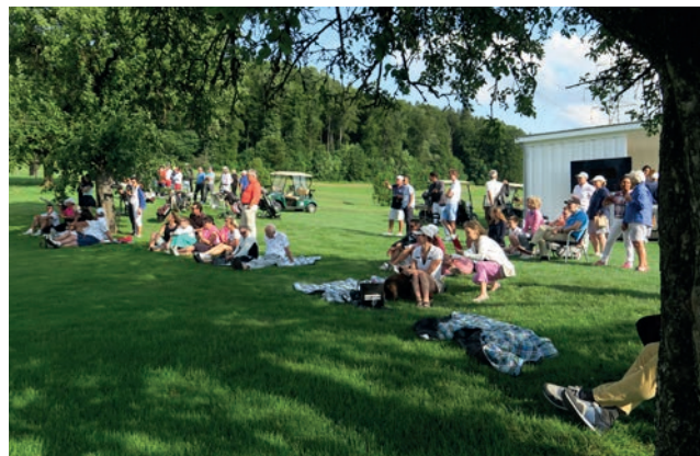
Zahlreiche Zuschauer und Golfspieler genossen am Halfway House das Grillbuffet und verfolgten die Clubmeisterschaften hautnah.