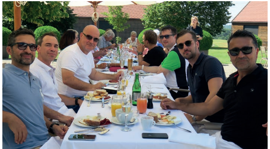
Mitglieder geniessen den ausgiebigen Brunch auf der Terrasse des Restaurants La Gloria nach dem Hahnenschrei 6h Shotgun Turnier 2019.