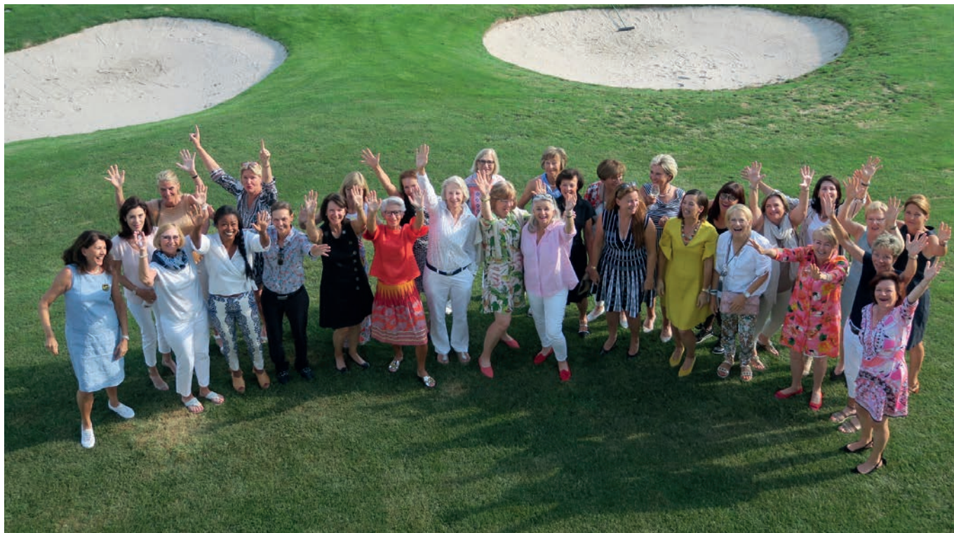
Kunterbunte und fröhliche Damen an den Ladies Meisterschaften 2019.

Aktiv, ambitioniert und aufgestellt, so präsentierten sich die Sempacherinnen auch in dieser Saison, mit Highlights wie den Ladies Meisterschaften, der Belek-Reise, drei Freundschaftstreffen und unserem «Invitational».