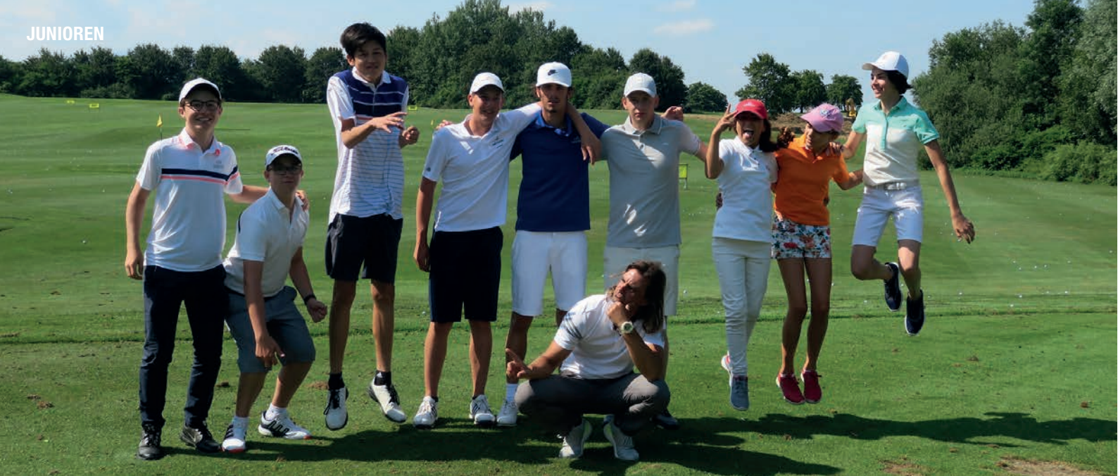
Die Juniorinnen und Junioren trainierten im Summer Camp ihre golferisches Können und lebten dabei ihre Energie sowie ihre Begeisterung für den Golfsport aus.