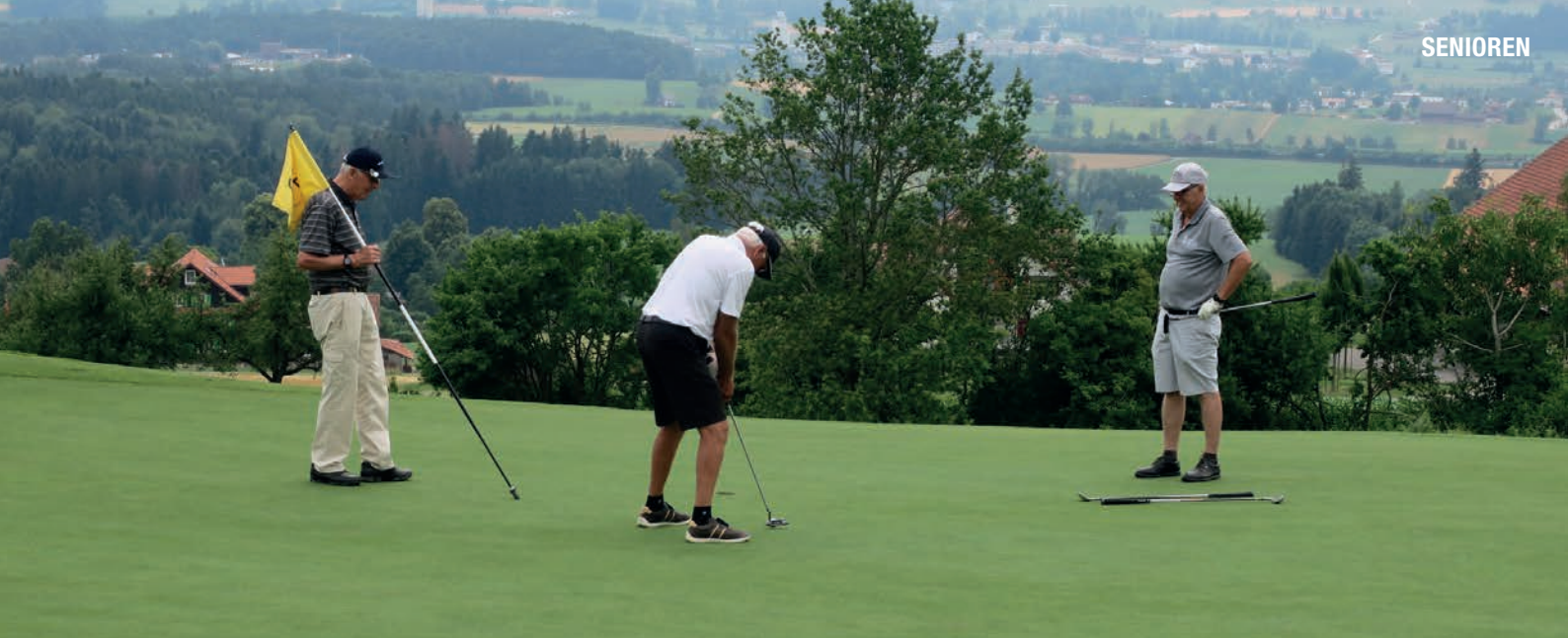
Motivierte Senioren beim Putten an der 3. Senioren Challenge 2019.