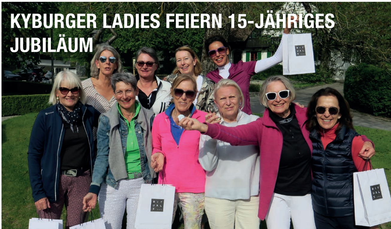
Die Ladies feiern den Frühling und die Siegerinnen des Ladies Glücksball Turniers 2019.

Es war ein toller Sommer und leider ziemlich Nass im Frühling, doch der Spass war immer im Vordergrund! Wir hatten vieles zu feiern. Besonders dieses Jahr, da es unser 15. Jubiläumsjahr ist – am 20. Juli 2004 hatten wir das erste Ladies Day Turnier auf Golf Kyburg mit 34 Kyburgerinnen. Seitdem ist die Anzahl unserer Mitgliedschaften stetig gewachsen – bis zu 100 Ladies. Doch wir haben immer noch Platz für weitere Ladies!