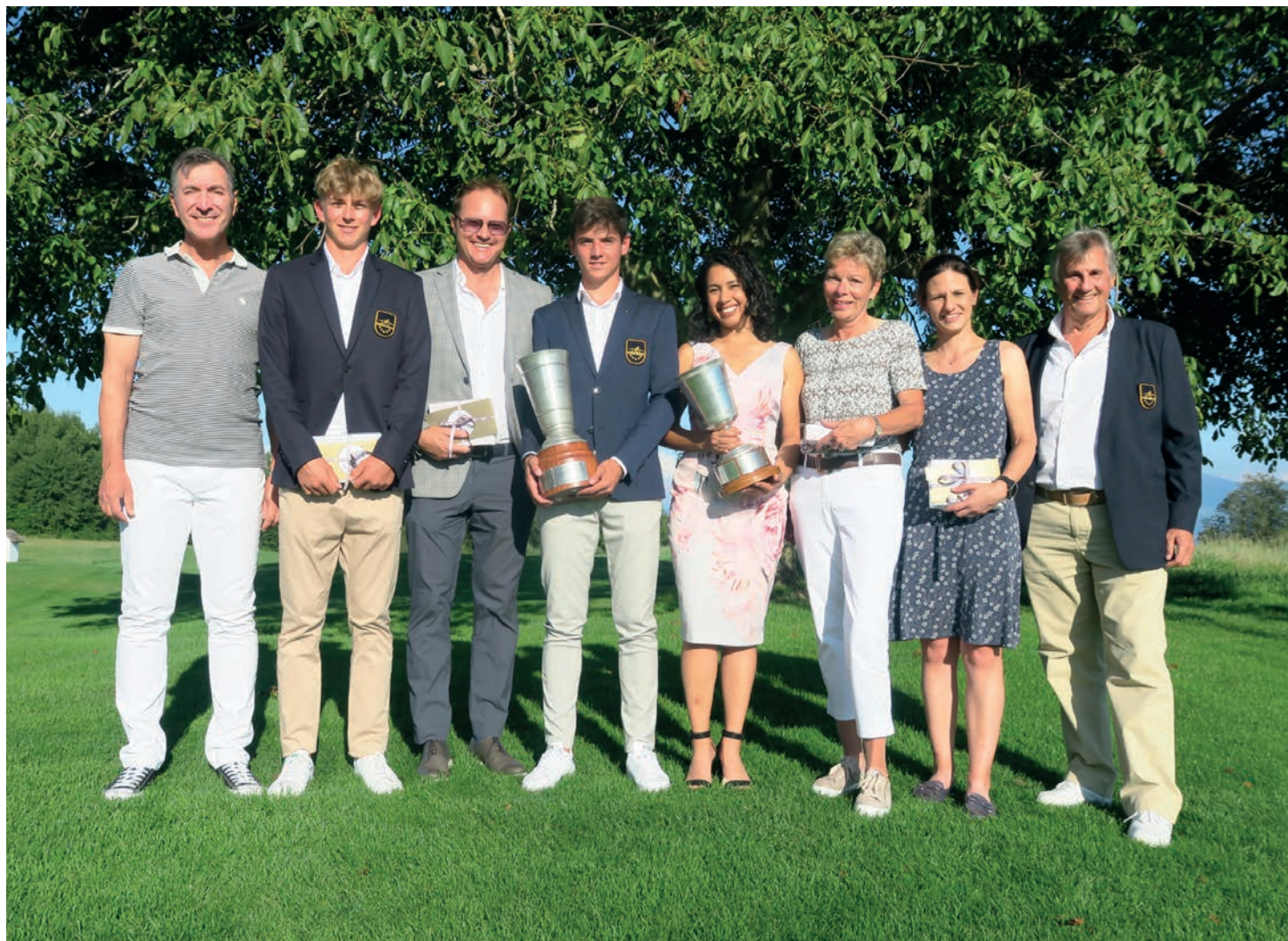
Die Clubmeister 2019 des Golf Club Sempachersee.

GOLF SEMPACH CH-6024 Hildisrieden Tel +41 41 462 71 71 www.golf-sempach.ch