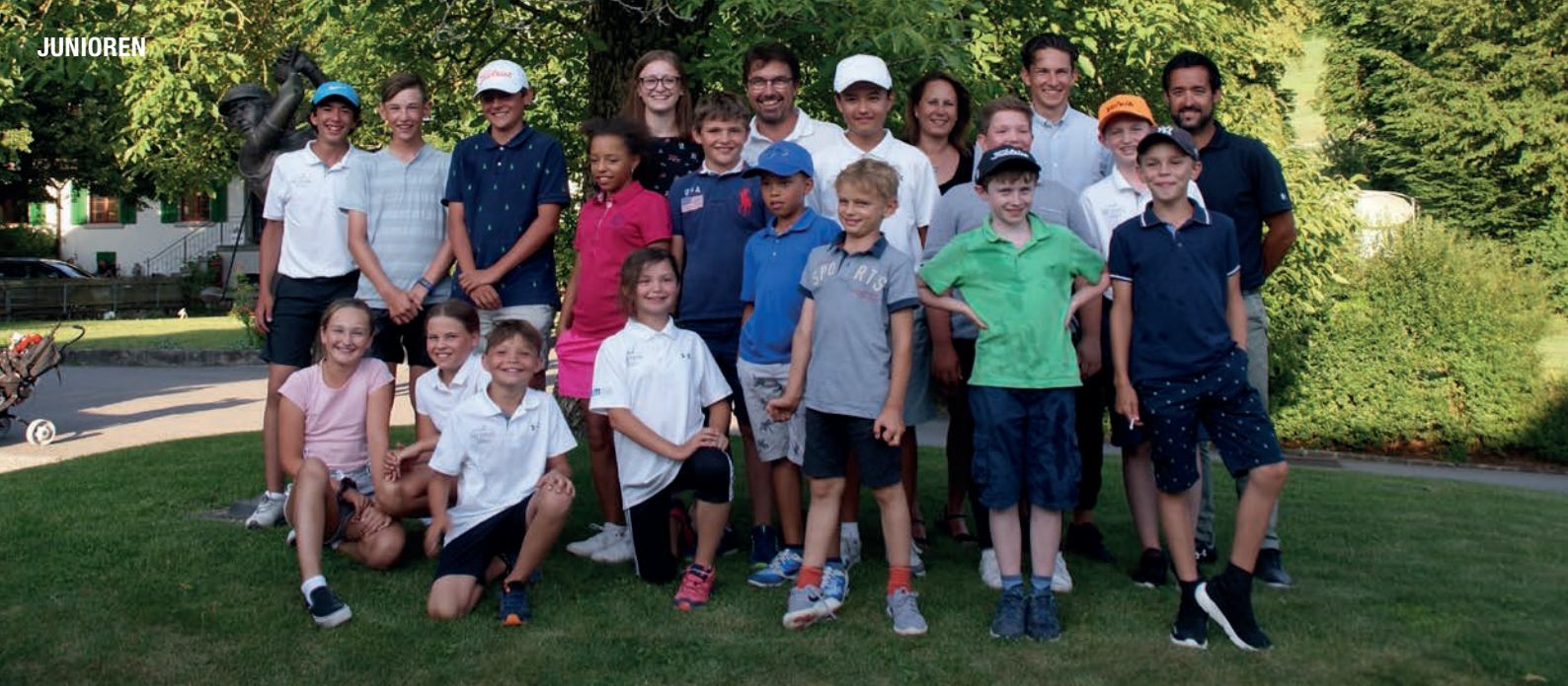
Strahlende Kinderaugen im Summer Camp 2019.