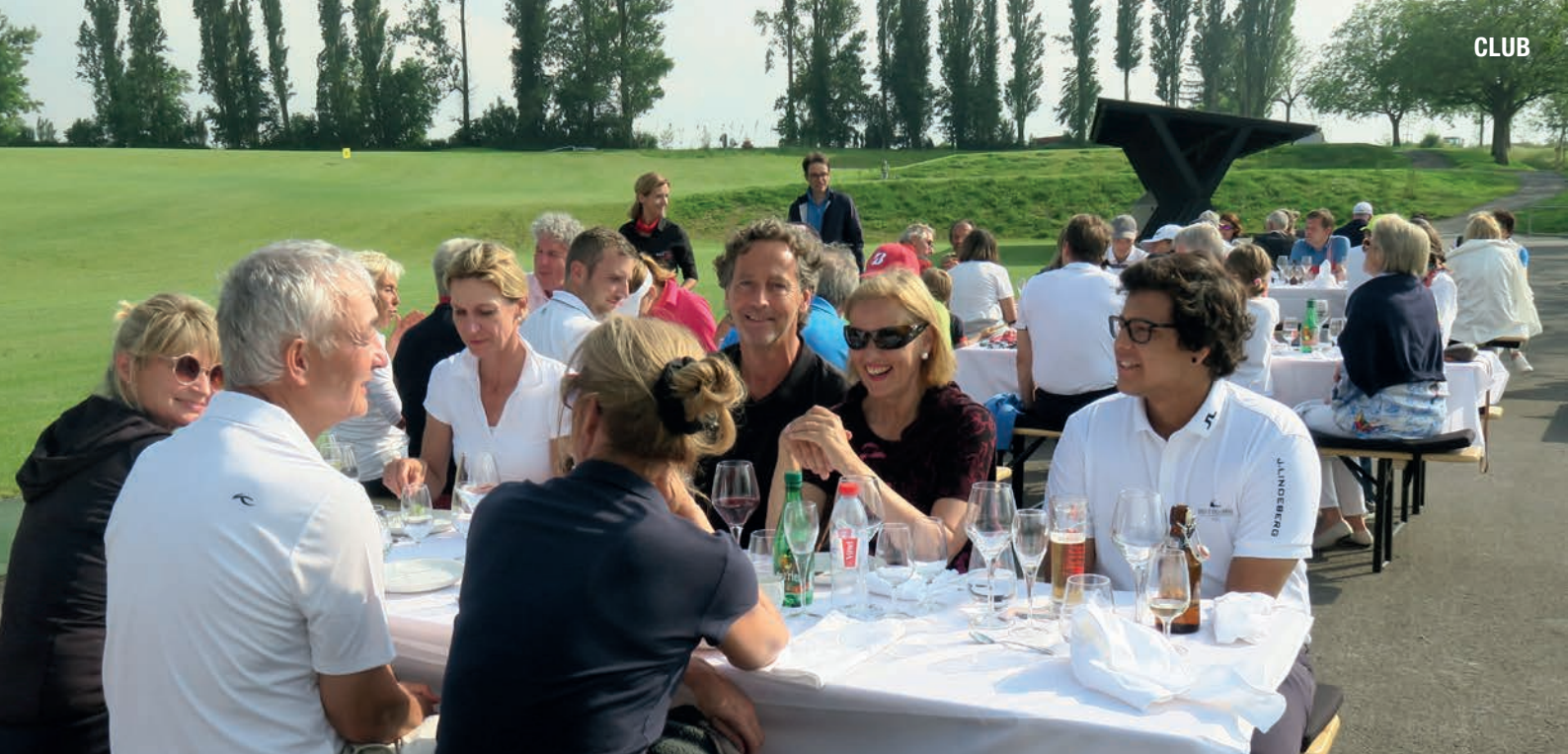
Mitglieder genossen das Clubleben mit Grill-Event und gesellschaftlichem Beisammensein nach dem President's Prize 2019.