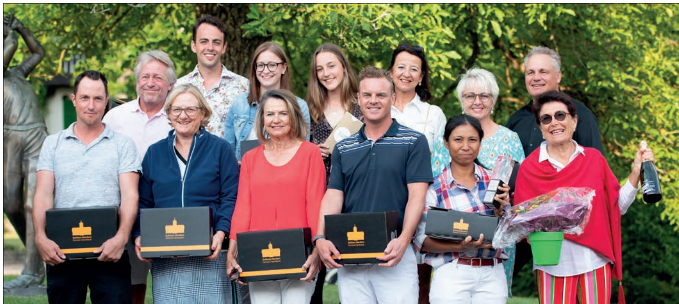
Die Gewinnerinnen und Gewinner der Clubmeisterschaften und Club Open 2019.