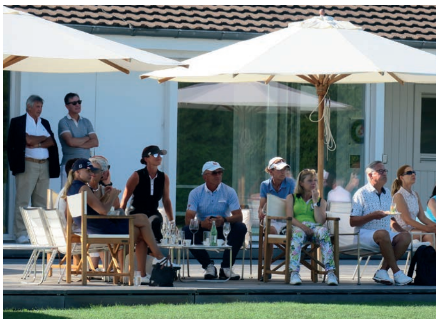
Zuschauer beobachteten die präzisen Schläge der Flights auf der Terrasse vor dem Clubhaus.