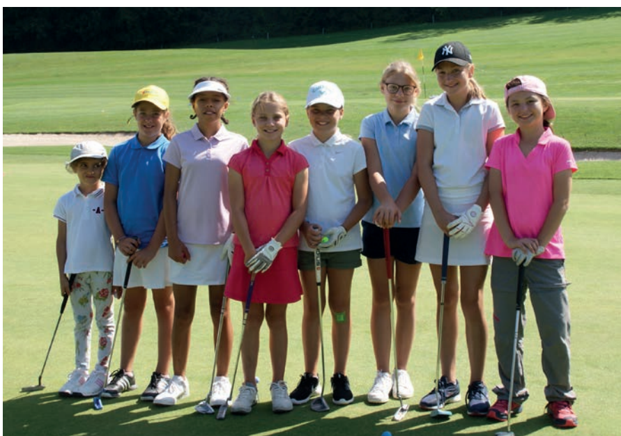
Im Summer Camp 2019 trainierten die Juniorinnen mit viel Elan und Energie ihre golferischen Fertigkeiten auf den Übungsanlagen – der Spass und die Freude am Golfsport kam dabei nicht zu kurz.