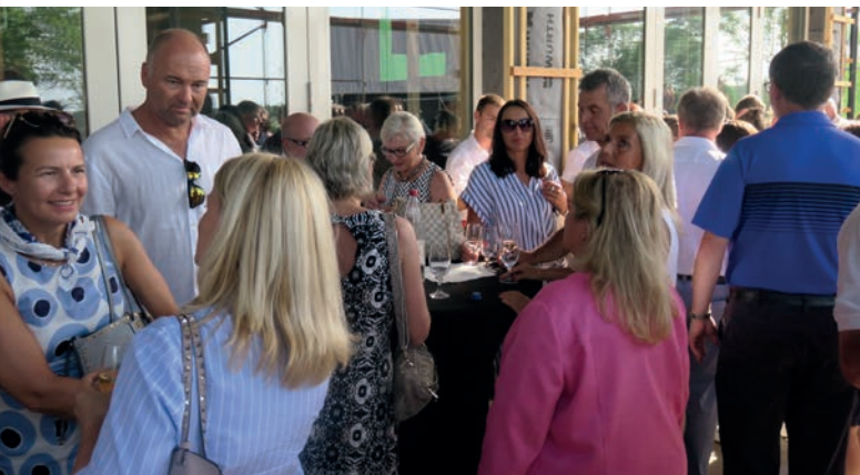
Die Mitglieder liessen den Abend beim ausgiebigen Apéro Riche ausklingen und stiessen auf eine erfolgreich erste Saisonhälfte an.