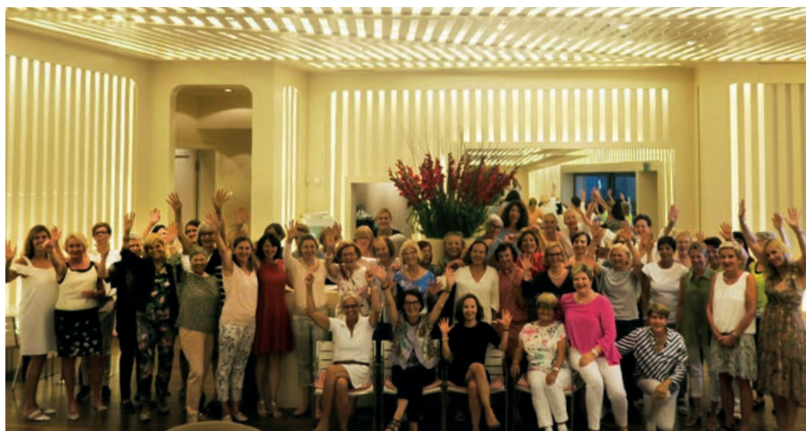
Ladies «Invitational» – ein grossartiger Anlass mit interessanten Gesprächen und toller Stimmung.