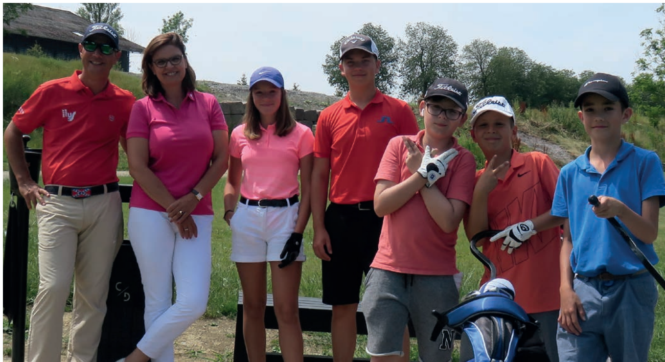
Das erste Summer Camp auf Golf Saint Apollinaire war ein voller Erfolg mit tollen und lehrreichen Golfaktionen.