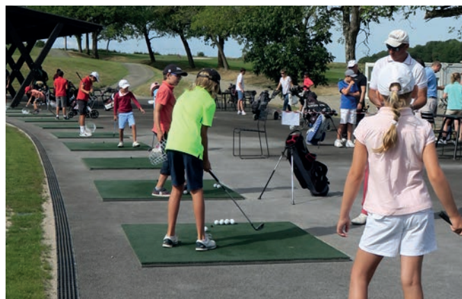
Auf der Driving Range feilen die talentierten Golfportler an ihrem Abschlag.