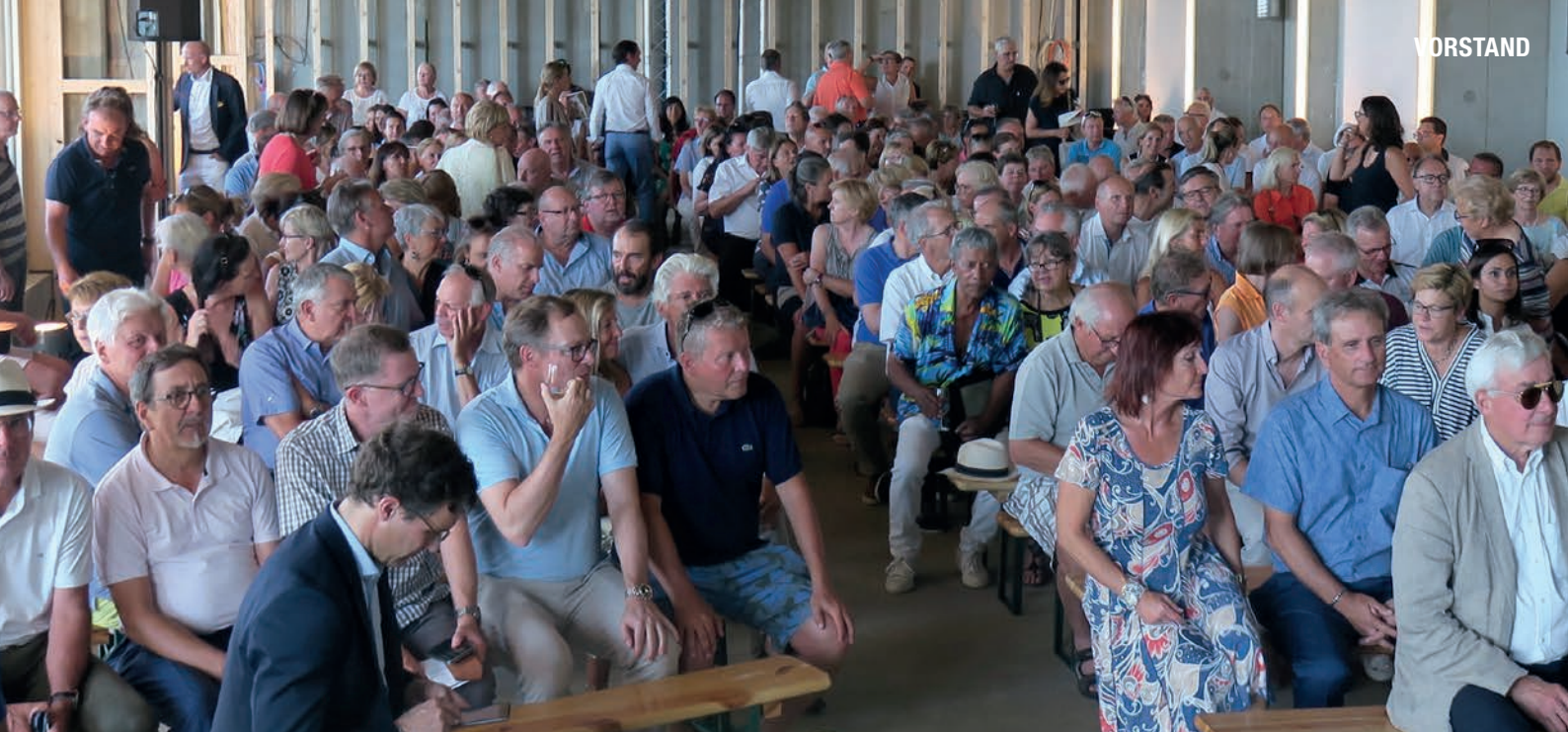
Über 300 Mitglieder trafen sich zur 1. ordentlichen Generalversammlung im zukünftigen Clubhaus auf Golf Saint Apollinaire.